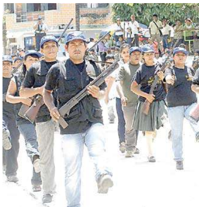
■ Comando Conjunto de FFAA. se pronunció en contra de armar a comités de autodefensa.

Explicó que estos comités fueron creados en el año 1991 para hacer frente a la amenaza del terrorismo, el tráfico ilícito de drogas y la delincuencia en zonas declaradas en estado de emergencia y que, por lo tanto, tenían una vigencia temporal.