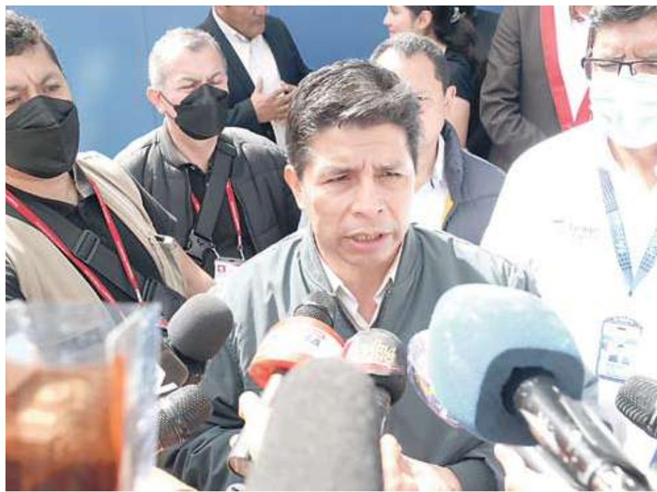
■ Pedro Castillo acusado de entorpecer captura de exministro Juan Silva

Mandatario tuvo acceso a información reservada que permitió a juez dictar orden de detención contra exministro