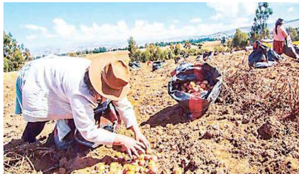
■ Agricultores y ronderos se suman a medida de fuerza desde el lunes.

Las rondas campesinas, también anunciaron un paro nacional para el lunes, 27 de