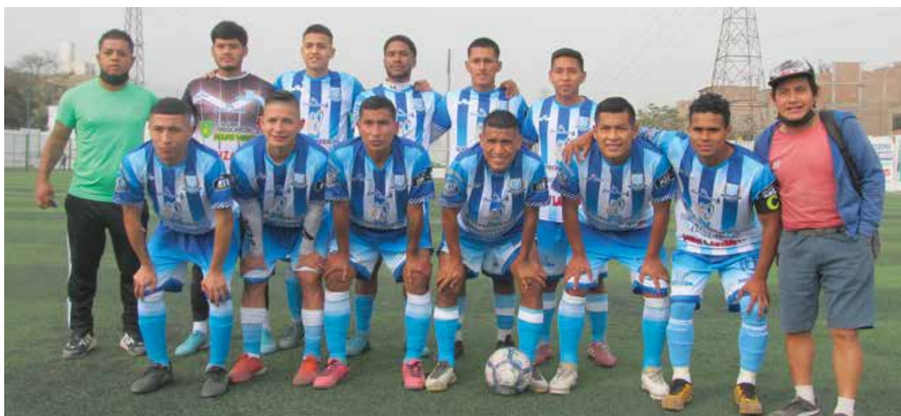
Este es el equipo Estudiantil Ascope del Cercado de Lima. Ahora, jugará ante Independiente San Felipe de Carabayllo

El distrito de Independencia es el único que tiene dos representantes. El primero es Dinámico Imperial que se mide