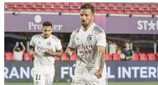
Colo Colo de Chile con Costa se quedó muy cerca de ir a octavos de Libertadores. ahora, está en la Sudamericana.

A igual que la Libertadores, la Copa Sudamericana también paralizó por los repechajes mundialistas y amistoso FIFA. Ahora, el segundo torneo de clubes más importante de Sudamérica regresa en su etapa más atractiva, los octavos de final.