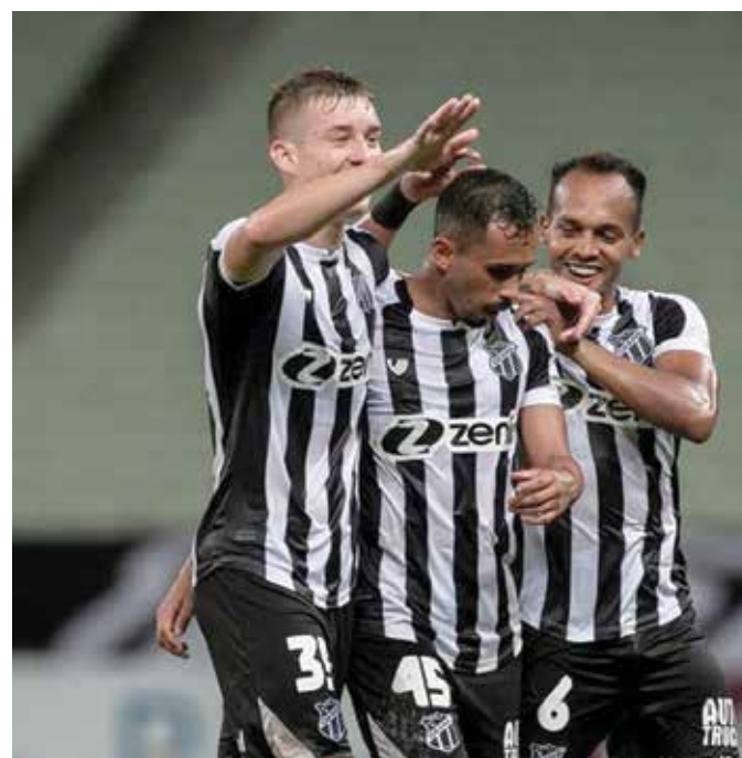
Ceará de Brasil es el único club que hizo puntaje perfecto en la Fase de Grupos de esta Sudamericana. Se perfila como candidato. Elimina a Independiente de Argentina.