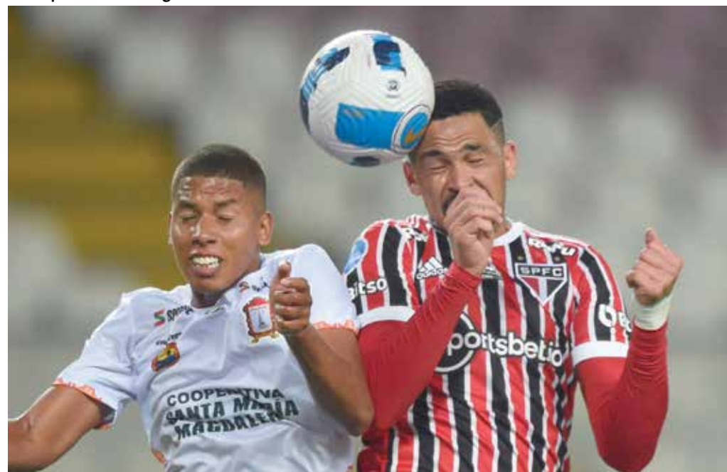
Sao Paulo también se perfila como candidato. En Fase de Grupos ganó a Ayacucho FC, tanto en la ida como la vuelta.

Este miércoles reinicia todo con los duelos de ida de octavos de final, y la competencia continuará (ver fixture), y tendrá algunas paralizaciones, pero la idea es acabarlo el 1 de octubre con la gran final única en el estadio Mané Garrincha de Brasil.