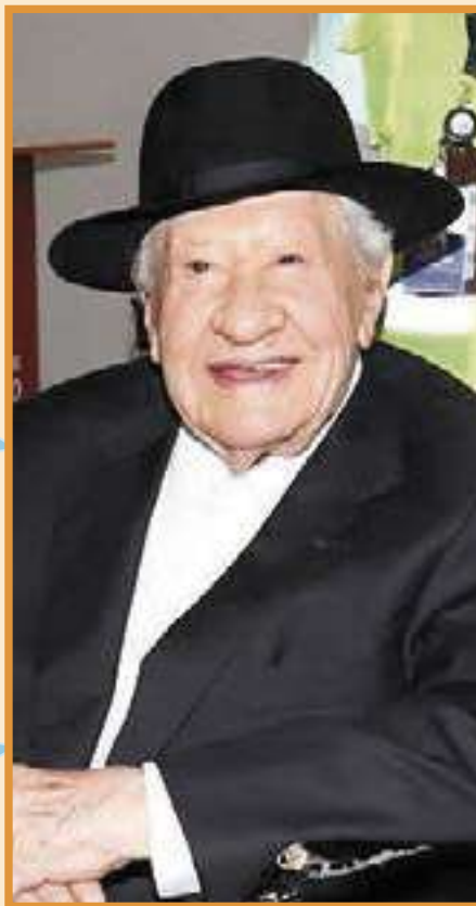
IGNACIO LÓPEZ TARSO