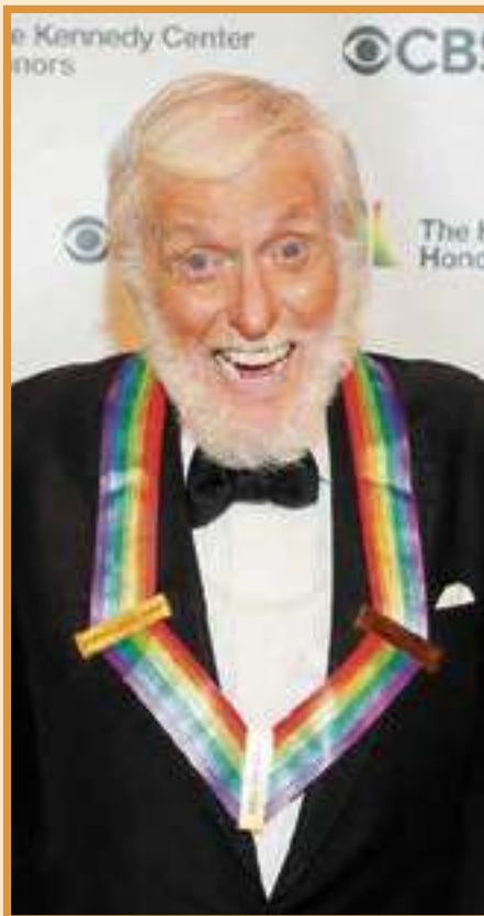
DICK VAN DYKE