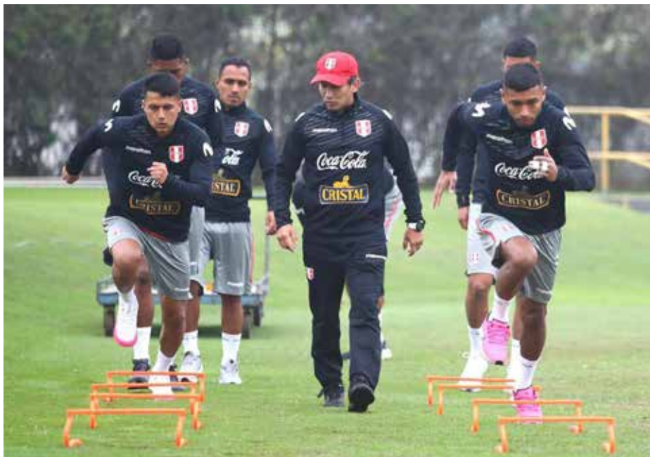
Los futbolistas del selectivo de Liga 1 trabajaron de manera aparte.

balón, mientras que en la tarde se hicieron detalles más estratégicos para que pueda implantarse un sistema.