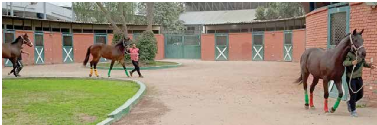
Momento de la llegada de los productos del Haras Rancho Sur. El segundo grupo estará llegando hoy antes del mediodía.