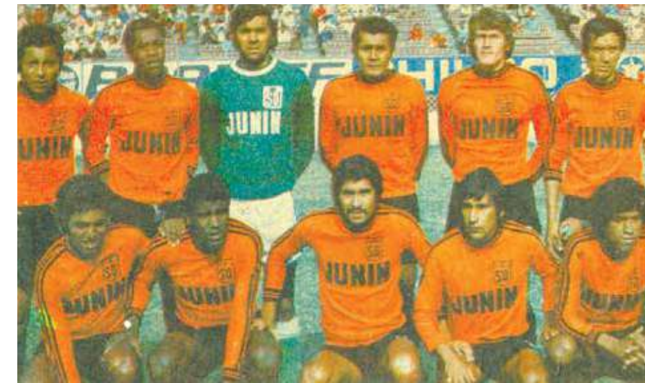
Este es el equipo del Deportivo Junín de Huancayo