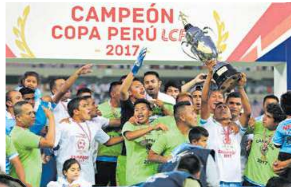
Binacional de Puno se llevó el título 2016

es la Asociación Deportiva Tarma. Ya se van disputando 48 ediciones. Este torneo se inicia el mes de febrero y culmina en diciembre. Participan aproximadamente 1,200 ligas distritales, 12,500 clubes y 300 mil jugadores cada año, a nivel nacional. El día 23 de agosto, la Federación Peruana de Fútbol emitió la Resolución 026, en la cual indican que a partir del 2023 no habrá ascenso directo a la Liga 1 sino a la Liga 2. Creo que los ascensos si de b e r í a n