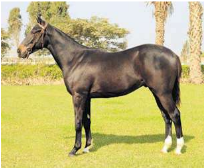
Este precioso castaño es un hijo de Southdale en Pasión Hípica, por Flanders Fields, una de las piezas más importantes del Haras Rancho Sur para la subasta del sábado 24.