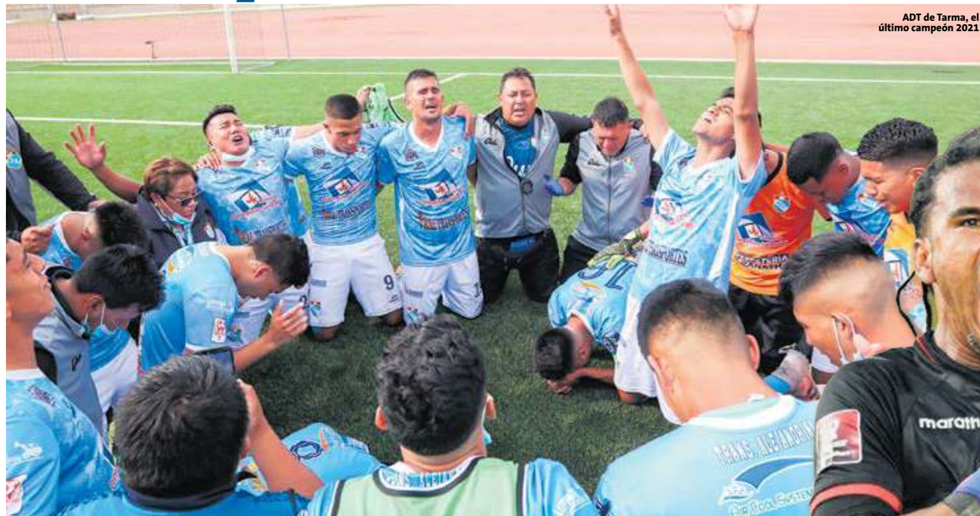
ADT de Tarma, el último campeón 2021