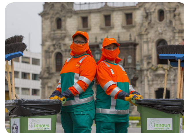
■ Advierte que Innova Ambiental brinda el servicio de limpieza pública hace 27 años en Lima Centro.

Las empresas deben implementar transparencia en sus contratos y actuar de acuerdo a ley. Asimismo, los municipios deben controlar los trabajos que realizan porque hay varios distritos cuyas avenidas principales se han convertido en un muladar donde se bota la basura y muchas veces no se recoge nunca, por lo que podría llegar a afectar a la población. Otro problema son las aguas residuales de Lima ya que lamentablemente no están siendo atendidas de manera correcta.