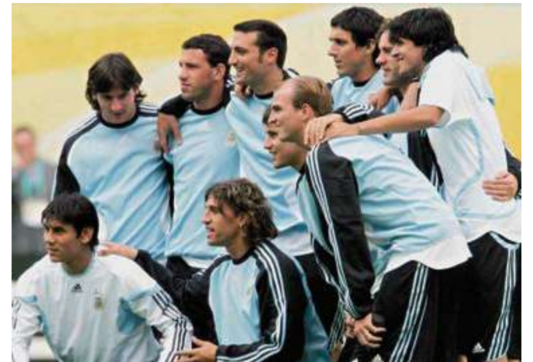
Dieciséis años atrás, cuando eran dirigidos por José Pekerman en Alemania 2006 y quedaron en cuartos de final.

lo ponía en práctica en el colegio de sus hijos que tenían 8 años. "Quería que hagan jugadas, triangulaciones y me dijeron que no hiciera eso. Me di cuenta que eso no era para mí, entonces me fui a un club con chicos de 14 años y ya sí me sentía muy cómodo", señaló. A través de Jorge Sampaoli, Scaloni desembarca en la selección argentina. "Mi papá y Sampaoli eran muy amigos. Él siempre ayudaba a mi padre en el banco y cuando se va a Sevilla, me ofrezco a ir gratis por vivir la experiencia. Luego de estar siempre en Sudamérica llegaba por primera vez a Europa y además yo conocía España", dijo. El resto es historia conocida: en 2017 llegan ambos a la selección de Argentina. Tras la salida de Sampaoli luego del mundial Rusia 2018, Scaloni no duda en asumir y no se equivocó: le dio su tercera copa mundial a Argentina e inmortalizó la figura de Lionel Messi.