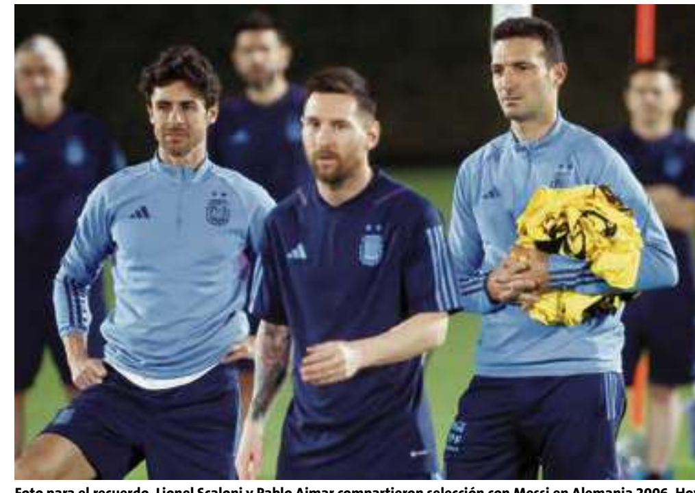
Foto para el recuerdo. Lionel Scaloni y Pablo Aimar compartieron selección con Messi en Alemania 2006. Hoy dirigen al mejor jugador del mundo.