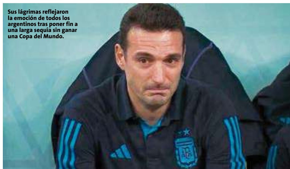
Sus lágrimas reflejaron la emoción de todos los argentinos tras poner fin a una larga sequía sin ganar una Copa del Mundo.

Además de ver a Lionel Messi levantando la Copa del Mundo con un atuendo peculiar que solo se les da a los reyes en Qatar, una escena emotiva de la final fue el llanto y posterior abrazo entre el seleccionador de Argentina, Lionel Scaloni y el volante Leandro Paredes. En aquel momento, Scaloni se persignó, levantó la cabeza y explotó en llanto. El primero en correr para darle un abrazo es Paredes, jugador ícono de su ciclo con la selección argentina y que llegó sentido al Mundial, por lo que no pudo tener