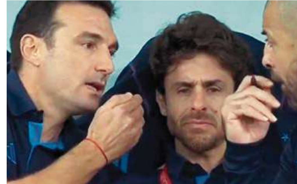
Pablo Aimar también lloró y fue tras el golazo de Lionel Messi ante México en el segundo tiempo.

También contó cuando jugó en la selección de Argentina junto a Lionel Messi en el mundial Alemania 2006, contienda que vio nacer al astro. "En el mundial de 2006