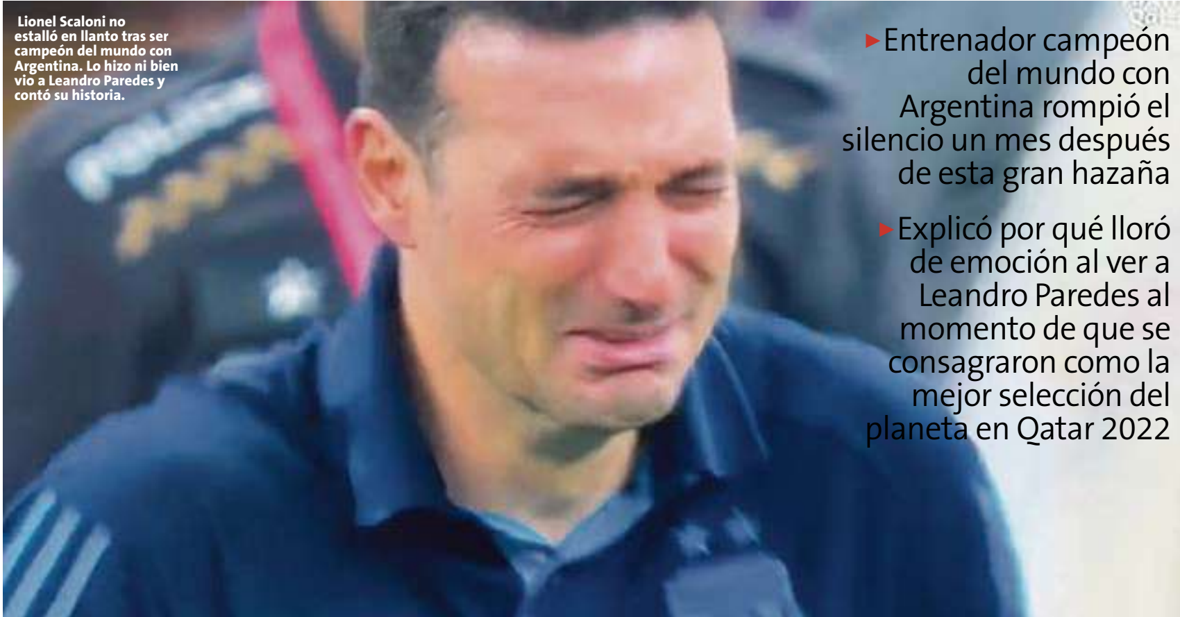
Lionel Scaloni no estalló en llanto tras ser campeón del mundo con Argentina. Lo hizo ni bien vio a Leandro Paredes y contó su historia.