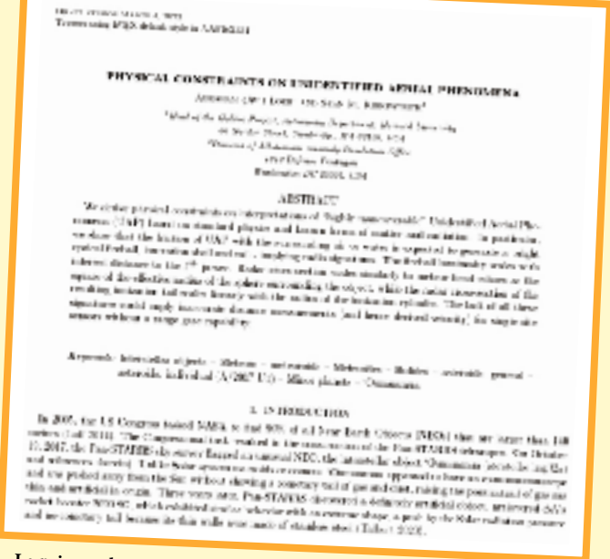
La primera hoja del borrador del estudio.

de interés” no identificados que puedan poner en peligro instalaciones militares, no cuenta con fondos más allá de los que son necesarios para el mantenimiento de una oficina. Esto puede cambiar con la crisis de los globos que ocupó las portadas el mes pasado. Un grupo de senadores de ambos lados del espectro político enviaron recientemente una carta a Washington en la que reclamaban la plena financiación de esta oficina. “AARO ofrece la oportunidad de integrar y resolver las amenazas y peligros para los EEUU, al tiempo que ofrece una mayor transparencia para el pueblo estadounidense y reduce el estigma”, afirma la carta de los legisladores. “El éxito de AARO dependerá de una sólida financiación de sus actividades y de la cooperación entre el Departamento de Defensa y la Comunidad de Inteligencia”. Mientras tanto, en la comunidad científica hay voces muy escépticas con los que califican de artificiales a objetos como ‘Oumuamua. Una actitud contra la que