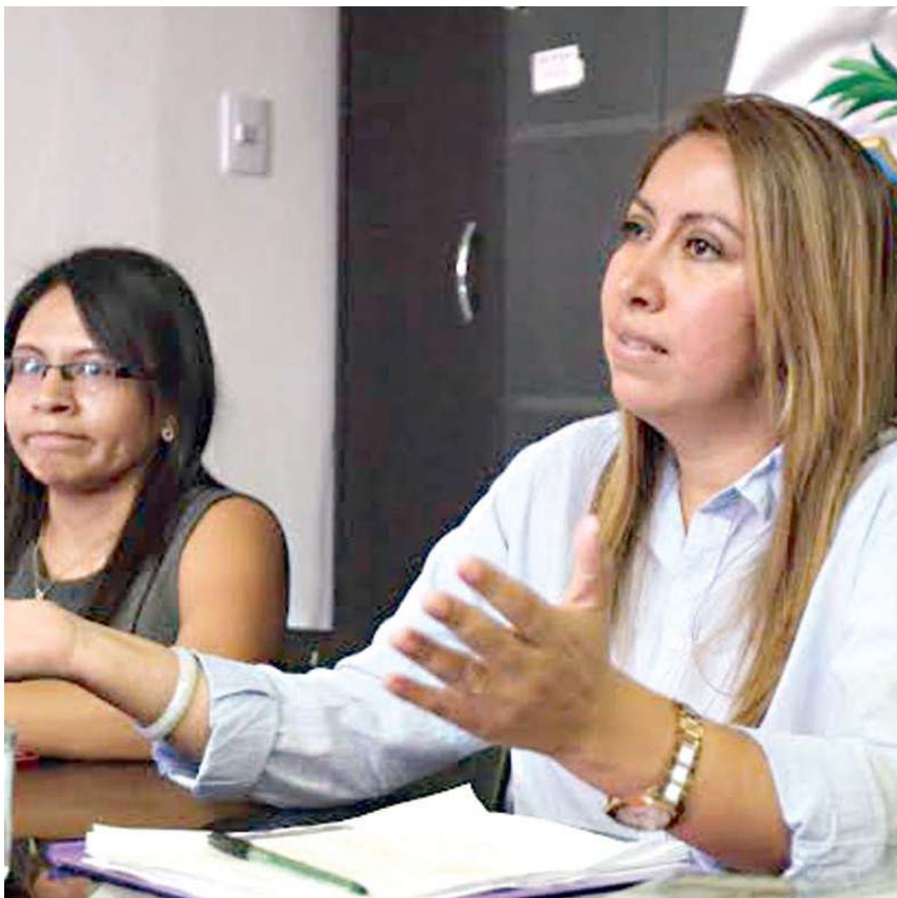
■ Exprocuradora Katherine Ampuero consideró que Betsy Chávez tiene los días contados.

¿Pero dicho plazo podrá verse ampliado al igual que lo que ocurrió con el segundo pedido de prisión preventiva