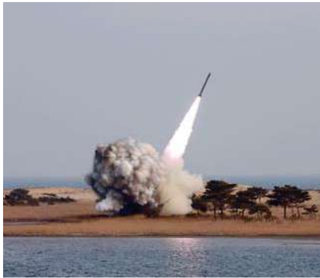
“Se vería como una clara declaración de guerra”

Pyeongyang alega que sus programas nuclear y armamentístico son de autodefensa y arremete contra los ejercicios militares de Washington y Seúl, que entiende como preparativos para una eventual invasión.