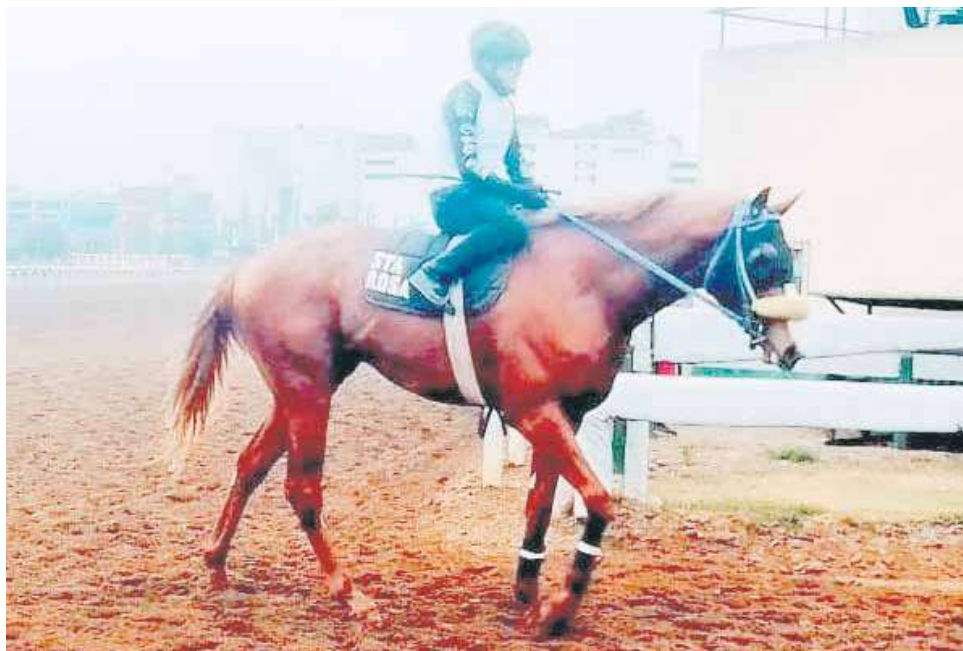
Gluck realizó un destacado ejercicio en la mañana de ayer. El hijo de Koko Mambo se alista para ser de la partida en el clásico "La Copa" (G2).

► Gluck hizo destacado ejercicio; Bella Genio para el "Enrique D. Barreda y Ricardo Barreda Laos"