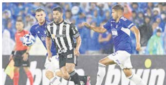
Mineiro igualó en Colombia 1-1 ante Millonarios, y tiene todo para clasificar porque define en su casa la llave.

de la Libertadores ya hay muchos peruanos asegurados y son Alianza Lima junto a