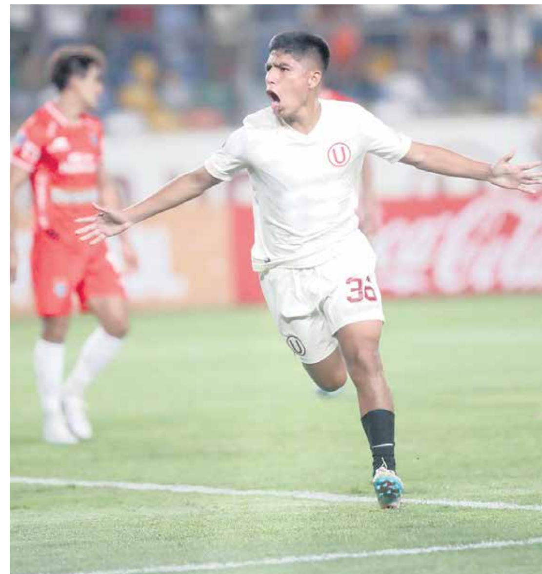
La 'U' jugará la Fase de Grupos de la Sudamericana y se ubica en el Bombo 2. Sus rivales saldrán del bombo 1, 3 y 4.