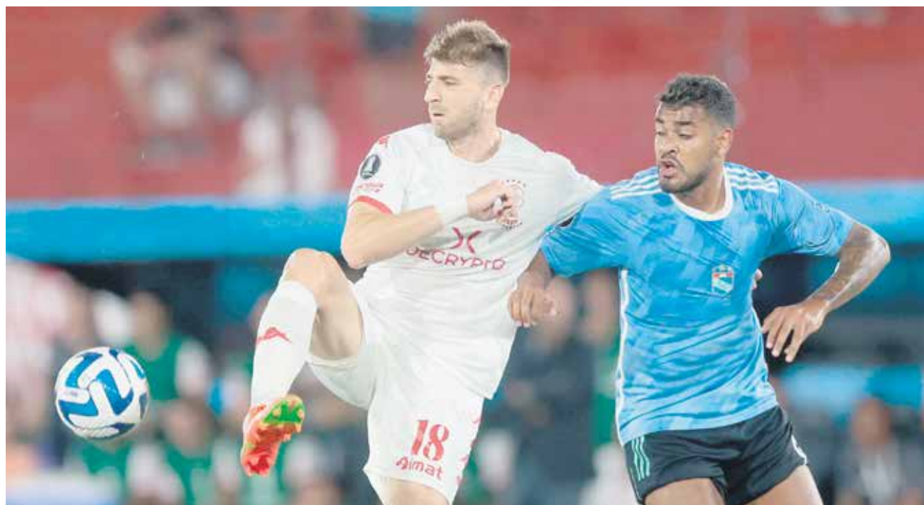
Cristal define su clasificación en Lima a estadio lleno frente al argentino Huracán.