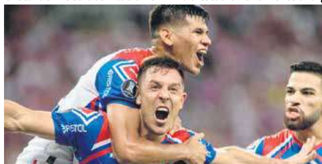
Cerro de Paraguay define su llave en casa, venció 1-0 a Fortaleza en Brasil. La mayoría quiere ver a los paraguayos en la Libertadores, pues en este torneo hay muchos brasileños.