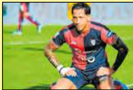
Frosinone tiene 67 unidades y sigue como líder absoluto de la Serie B.

Con este empate, Cagliari sumó 48 puntos y, por ahora, se ubica en la sexta casilla -zona de clasificación para play-offs-, mientras que