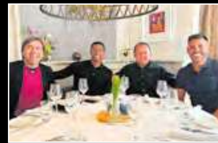
do a los diferentes seleccionados peruanos e incluso sostendría una reunión con el defensor danés con ascendencia peruana, Oliver Sonne.

Cabe señalar que Reynoso continuará visitan-