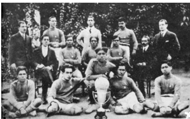
Alianza Lima volvió a campeonar en 1919