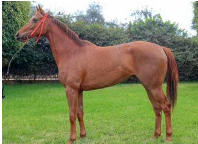
Esta alazana, hermana de Fino Sentimiento y su abuela NONNA TOSCANA es madre de la ganadora de la Polla de Potrancas, ALSACIA y el campeón de dos años SORPRESIVO. Está nominada para la "Copa Criadores" y ya dio su examen del partidor.

También serán subastadas las potrancas SURREAL, una Singe The Turf que ya logró su primera victoria y la alazana SILHOUETTE, hermana materna del corredor TONGA, ganador del "Gran Premio Nacional-Augusto B. Leguía" (G1). El lote ha merecido los mejores comentarios, se trata de productos de buen pedigree