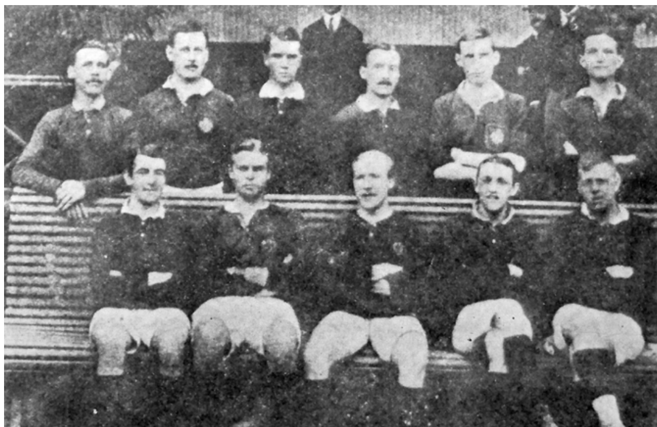
Lima Crickett and FBC fue el primer Campeón en 1912

► Nueve en Primera División y 8 en la Segunda Atlético Peruano es el equipo más antiguo del Rimac