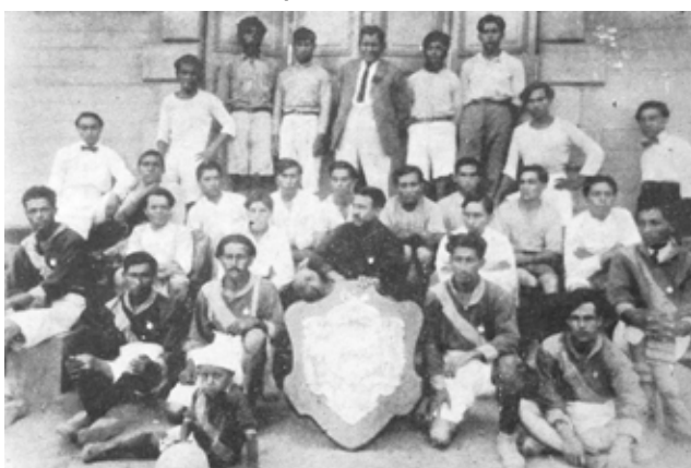
Centro Sport Inca del Rimac fue el Campeón en 1920