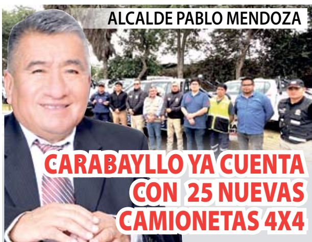
ALCALDE PABLO MENDOZA

CARABAYLLO YA CUENTA CON 25 NUEVAS CAMIONETAS 4X4