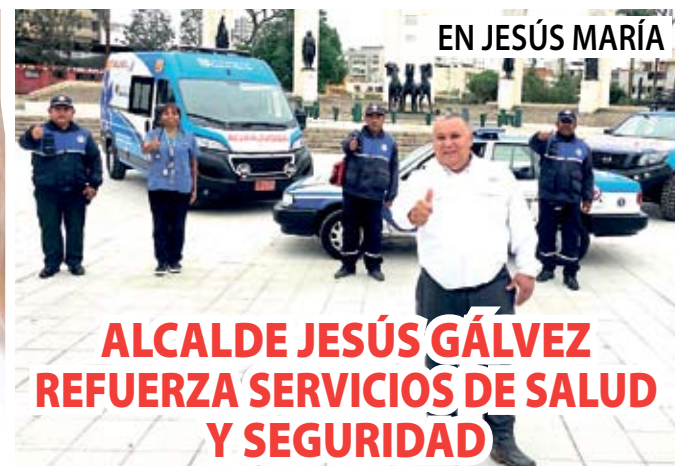
EN JESÚS MARÍA

SAN ISIDRO DA CHALECOS ANTIBALASA POLICÍAS DEL PATRULLAJE INTEGRADO