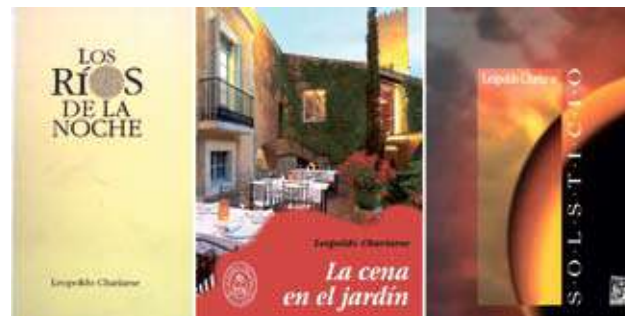
■ Portadas de sus libros de poesías "Los ríos de la noche", "La cena en el jardín" y "Solsticio".